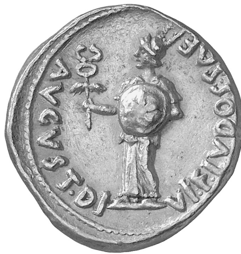
10. Aureus des Augustus mit »Herold« der Säkularspiele, 17 v. Chr. Münzkabinett, Staatliche Museen zu Berlin, L.-J. Lübke.