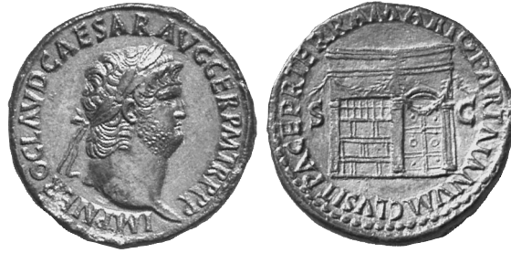
4. Sesterz des Nero mit Ianustempel, ca. 66 n. Chr. Münzkabinett, Staatliche Museen zu Berlin, L.-J. Lübke.