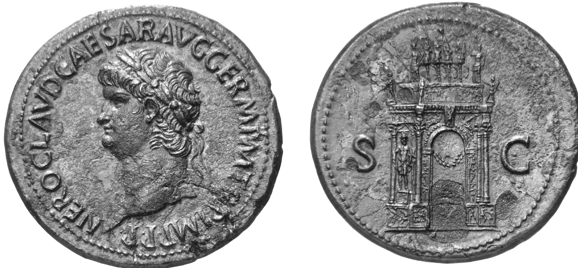
1. Sesterz des Nero mit Ehrenbogen, um 64 n. Chr. Münzkabinett, Staatliche Museen zu Berlin, L.-J. Lübke.