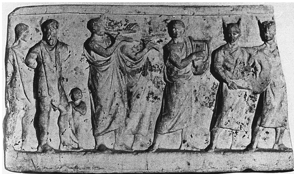
9. Relief in Pesaro, Slg. Castelli-Baldassini, mit Ausschnitt aus Triumphzug. Nach F. Fless, Opferdiener und Kultmusiker auf stadtrömischen historischen Reliefs (Mainz 1995) Taf. 10, 2.