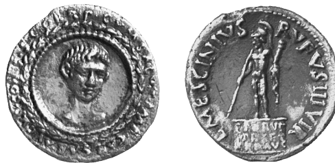
7. Denar des Augustus mit junglichem Mars auf Postament, um 16 v. Chr. Münzkabinett, Staatliche Museen zu Berlin, L.-J. Lübke.