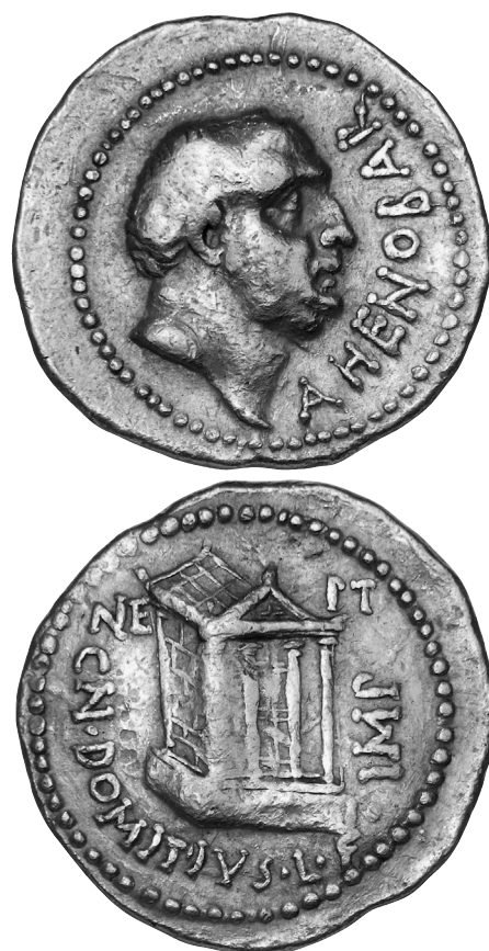
3. Aureus des Cn. Domitius Ahenobarbus mit Neptuntempel, 41 v. Chr. Münzkabinett, Staatliche Museen zu Berlin, R. Saczewski.