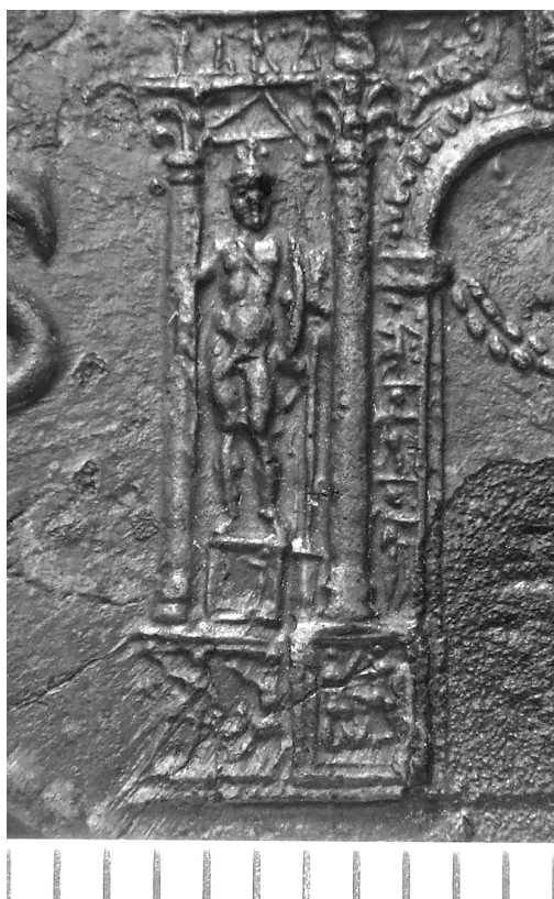
2. Sesterz des Nero mit Ehrenbogen, Detail: Marsstatue. Münzkabinett, Staatliche Museen zu Berlin, R. Saczewski.