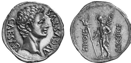
6. Denar des Augustus mit junglichem Mars Ultor, um 19 v. Chr. Münzkabinett, Staatliche Museen zu Berlin, L.-J. Lübke.