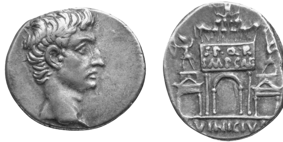
5. Denar des Augustus mit Partherbogen, 16 v. Chr. Münzkabinett, Staatliche Museen zu Berlin, R. Saczewski.